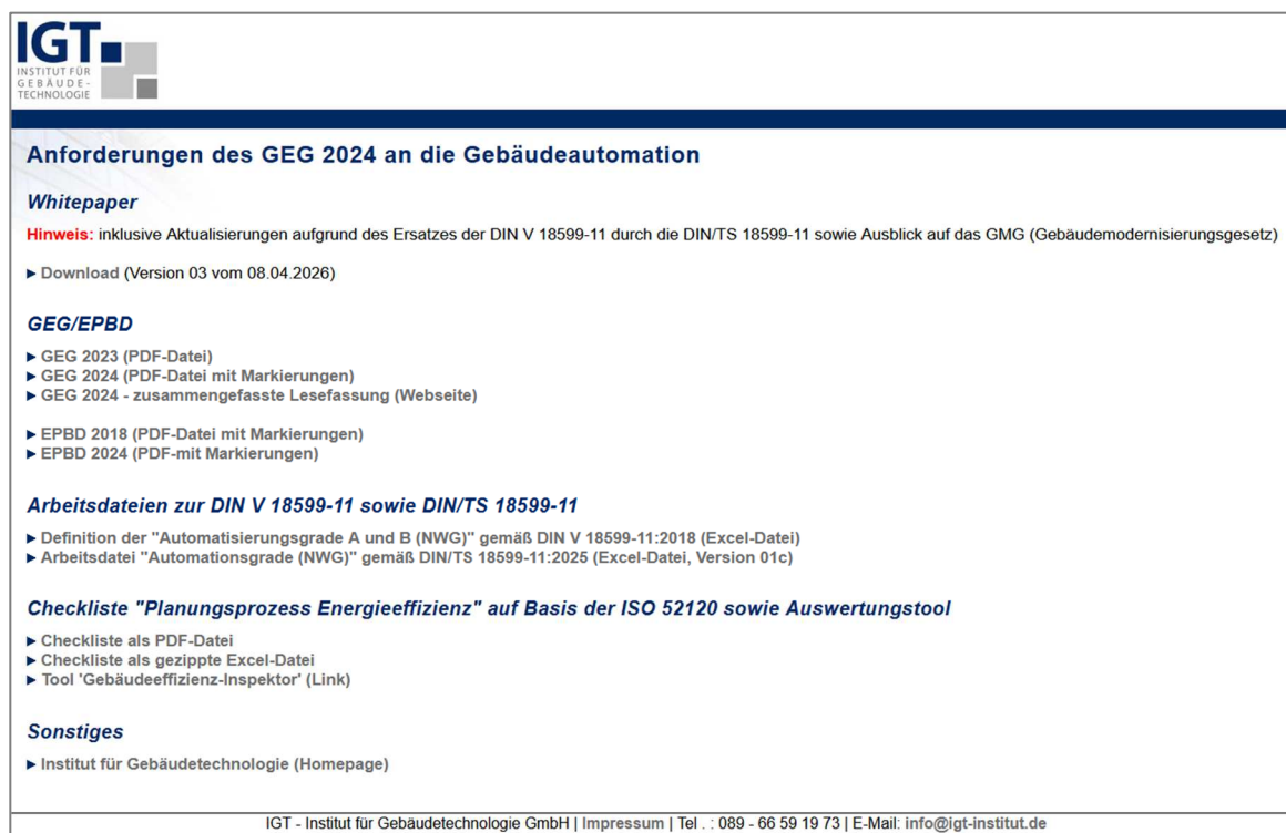
Abbildung 1: Webseite mit weiteren Dokumenten zum Whitepaper