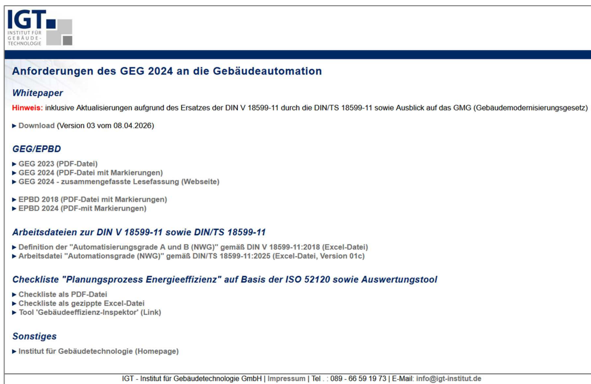
Abbildung 1: Webseite mit weiteren Dokumenten zum Whitepaper